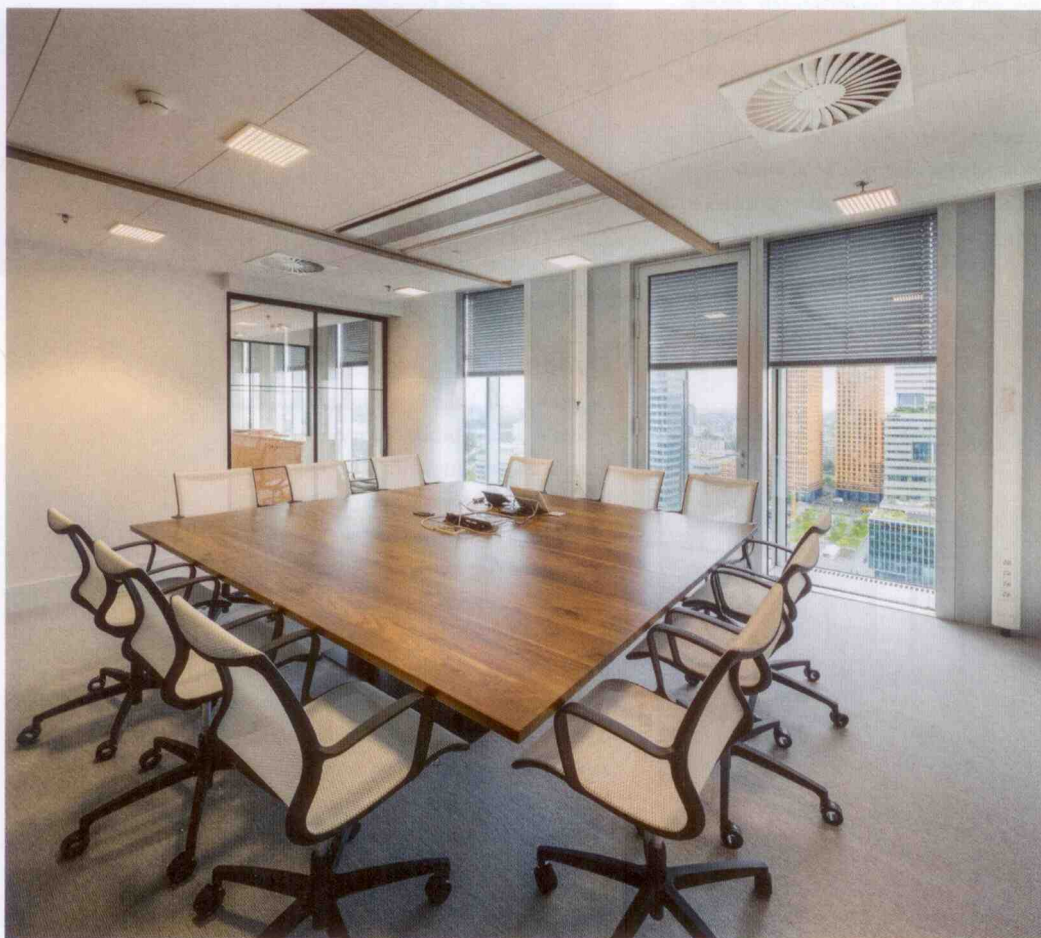
FOTO ONDER De boardroom.

het onderscheid tussen verkeers- en werkzone markeert. Uitzondering vormt de boardroom, die een grijze vloerbedekking heeft. In de boardroom staat een grote speciaal ontworpen tafel met een blad in notenhout, en ook is er een wand in noten waaraan beeldschermen hangen. In het plafond werd door Feenstra en Van Goor extra airconditioning geplaatst, een nadrukkelijke wens van de opdrachtgever; dit bedrijf paste ook de ventilatie aan het interieurontwerp aan. Om één vlak en één geheel te creëren zijn de bestaande plafondplaten vervangen en de plafondrasters voorzien van notenhouten balken. Alles in de boardroom wordt via domotica bestuurd, zoals de jaloezieën, conference calls, verlichting en ventilatie.